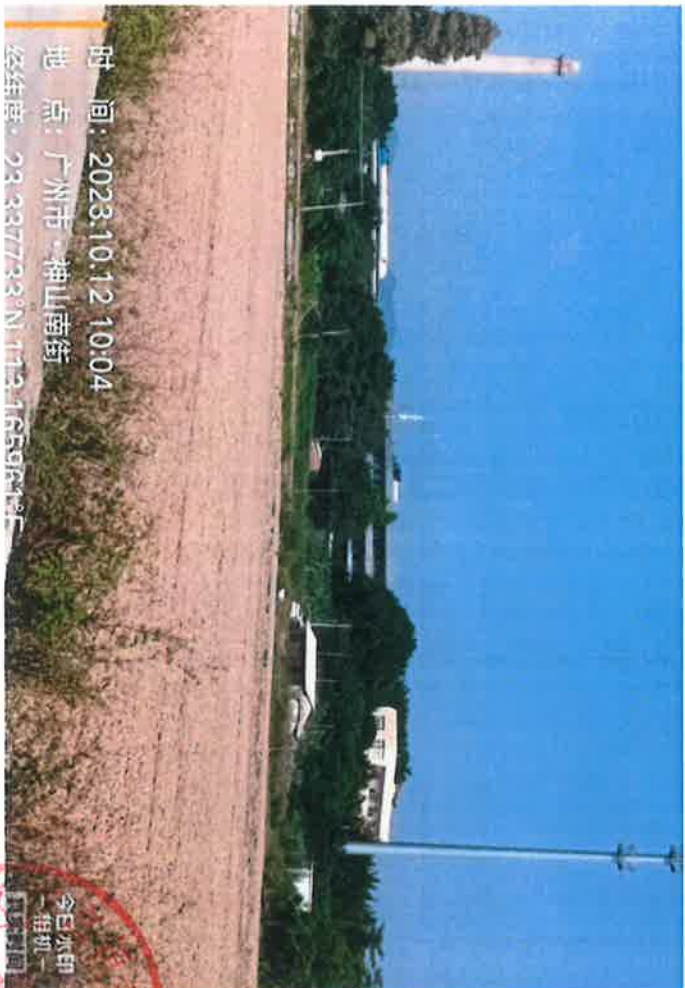
时间: 2023.10.12 10:04 地点: 广州市·神山南街 经纬度: 23.337733°N 113.165961°E