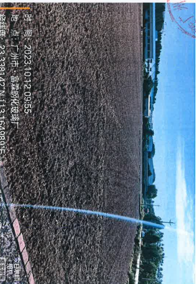
时间: 2023.10.12 09:55 地点: 广州市·富森钢化玻璃厂 经纬度: 23.338142°N 113.164989°E