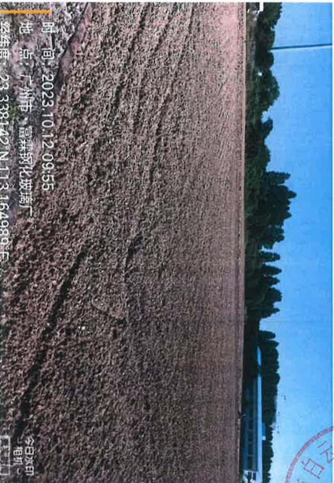
时间: 2023.10.12 09:55 地点: 广州市·富森钢化玻璃厂 经纬度: 23.338142°N 113.164989°E