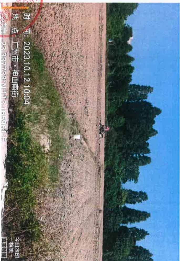
时间: 2023.10.12 10:04 地点: 广州市·神山南街 经纬度: 23.337733°N 113.165961°E